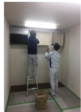
システムキッチンの組立

習得スキル：システムキッチン組立 トイレ・洗面台取付 後付サッシ取付 クロス張替え タイルフロア施工 網戸貼り替え 蝶番調整 接客対応など