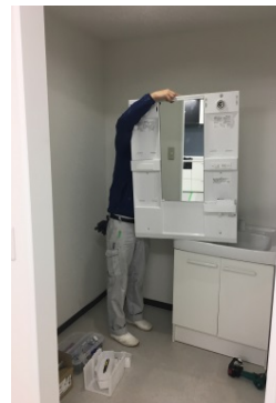
洗面化粧台の取付